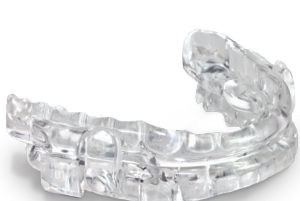
ProSomnus MicrO 2