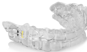
ProSomnus [CA] LP