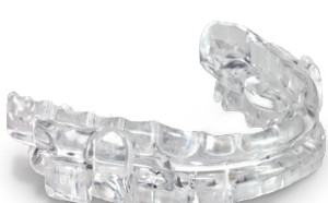
ProSomnus MicrO 2