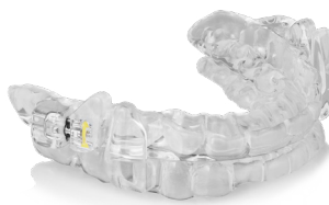
ProSomnus [CA] LP